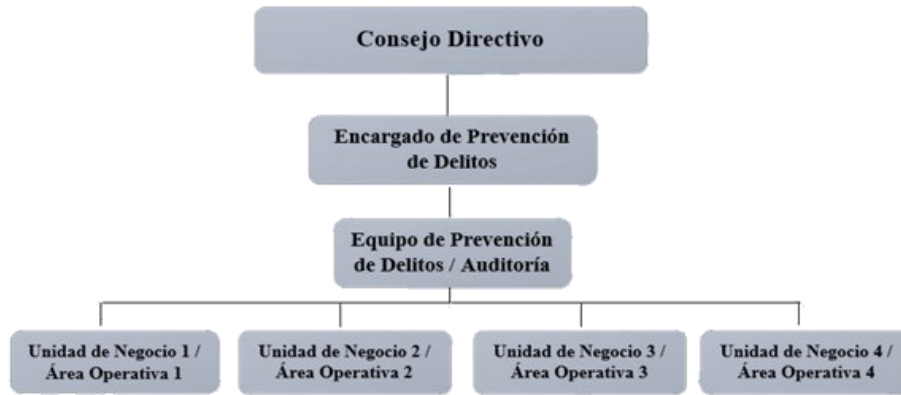
Figura N° 3: Estructura organizacional del Sistema de Prevención de Delitos