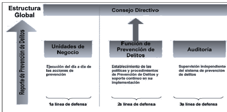
Figura N° 2: Estructura funcional del Sistema de Prevención de Delito

Se ha determinado la estructura funcional del Sistema de Prevención de Delitos de acuerdo a un modelo de tres líneas de defensas representado en la siguiente figura: